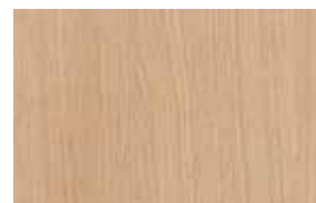
W9 – dub cremona světlý