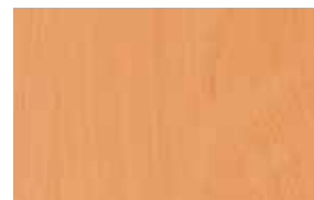
W4 – buk