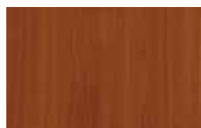
W7 – třešeň lombardo přírodní