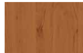
W5 – olše