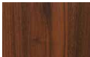
W17 – ořech americký