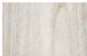
W8 – jasan krystal