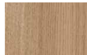
W10 – dub ferrara