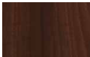
W16 – ořech aida tabákový