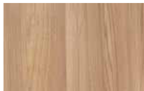
W11 – jilm natur