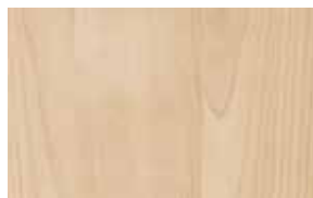
W2 – javor přírodní starnberg