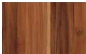
W6 – merano přírodní