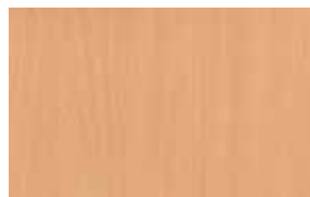
W3 – buk přírodní