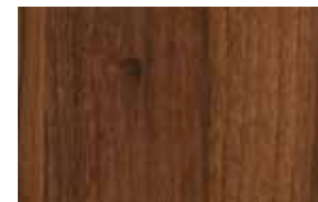
W15 – ořech dijon přírodní