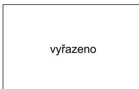
W13 – oliva