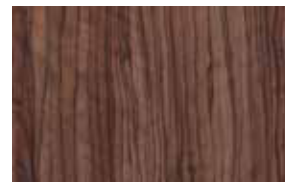
W14 – cordoba oliva tmavá