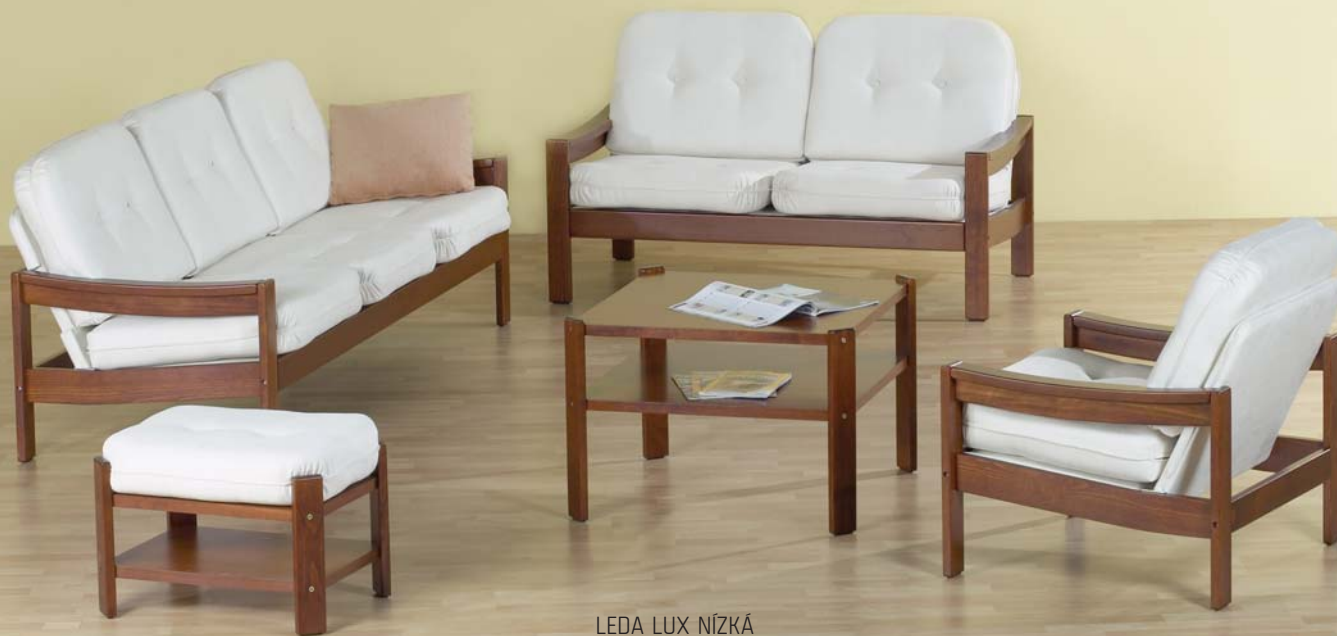
LEDA LUX NÍZKÁ