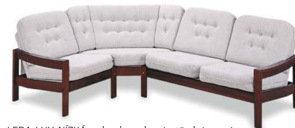
LEDA LUX NÍZKÁ pohovka rohová střední pravá