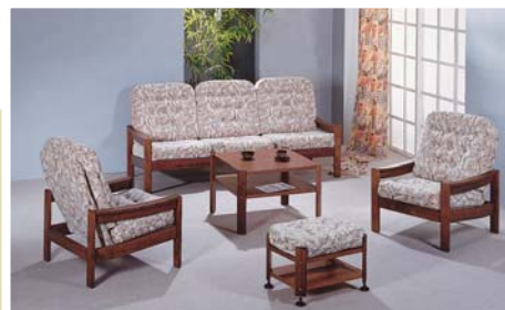
LEDA LUX VYSOKÁ