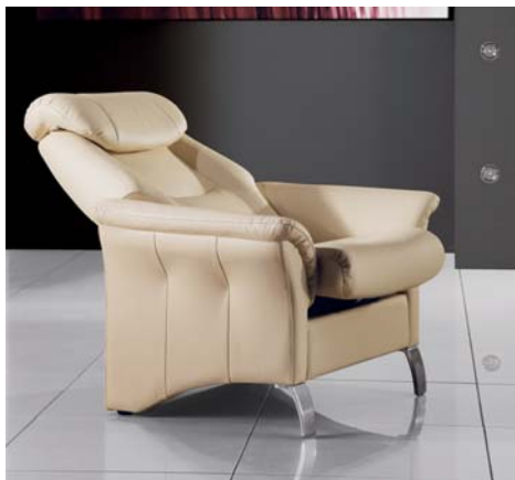
VERONA polohovací křeslo

Maximální komfort sezení! To je přednost souboru prvků křesla, dvojkřesla, trojkřesla s názvem Verona.